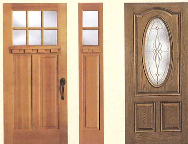
No.7662+No.7663SL (Clear) (Dentile Shelf)