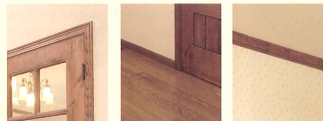
木製 (オーク) LP115 (ケージング)