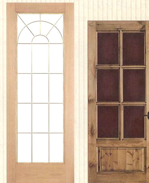
木製ガラスドア (オーク) No.1590R (金モール)