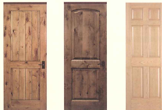
木製パネルドア (アンティーク調仕上) A2